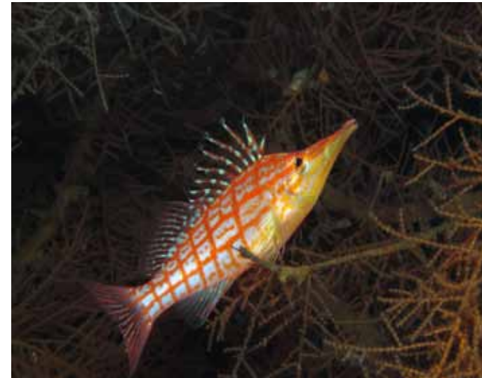
Langnasenkorallenwächter leben in grossen Fächerkorallen.

kann man hier mit 15-Liter-Flaschen tauchend, leicht zwei Stunden unter Wasser bleiben. Die Landschaft wird von einigen Erccs (Korallentürmen) geprägt. Überall hängen Schwärme gelber Ziegenfische über dem Riff.