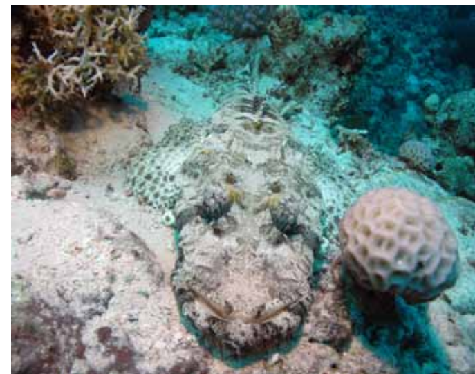
Der Krokodilfisch ist ein fauler Jäger, er lauert oft stundenlang und bewegungslos auf seine Beute.