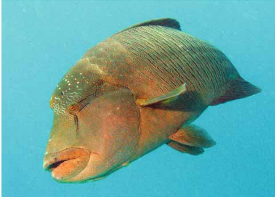
Obwohl der Napoleonlippfisch müde wirkt, ist er mitunter ein frecher Zeitgenosse.

Ein Schwarm Schwarztupfensüsslippen beäugt dicht gedrängt in einer Spalte die vorbeiziehenden Taucher. Auf 30 Meter Tiefe schwimmen wir zu einer kleinen Höhle, in der sich Tausende Glasfische tummeln. Für die hier heimischen Rotzahnbarsche das wahre Schlaraffenland. Wieder im oberen Teil des Riffs angekommen, schwimmt ein nicht allzu scheuer Napoleonlippfisch zu meiner Freude bis auf Kameradistanz zu mir heran.